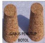
GABUS PENUTUP BOTOL