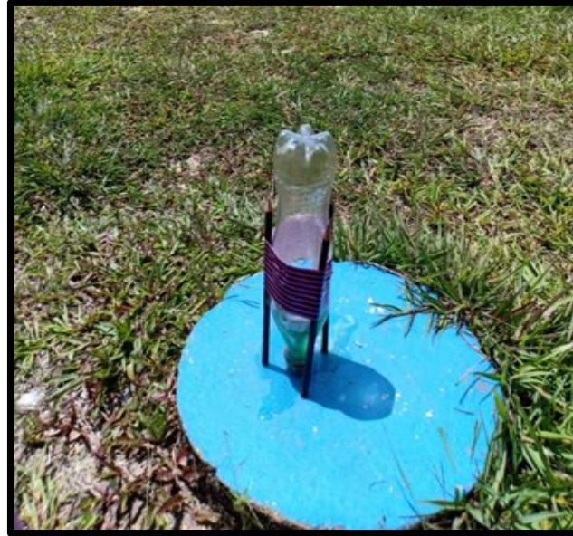
Kanak-kanak menguji roket botol STREAM yang dihasilkan